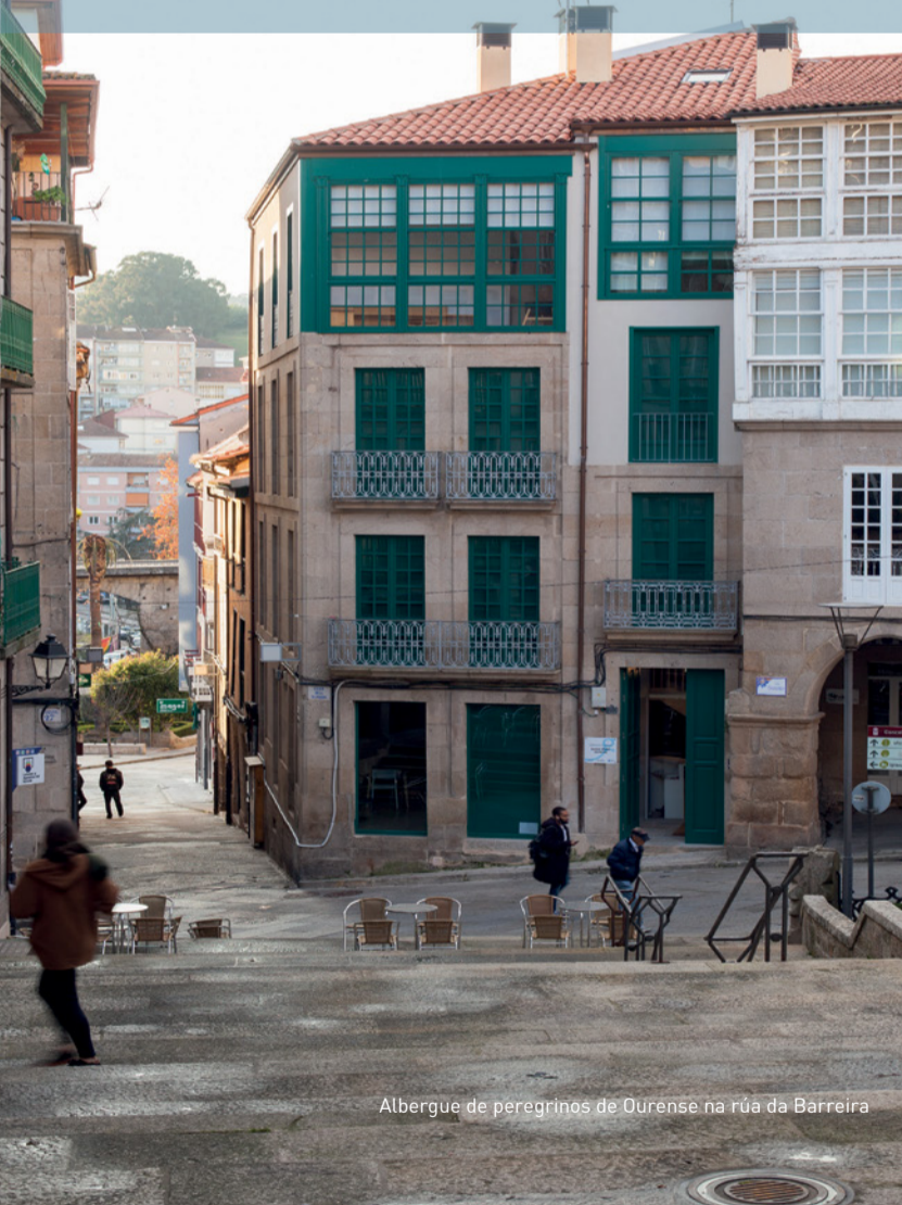
Albergue de peregrinos de Ourense na rúa da Barreira